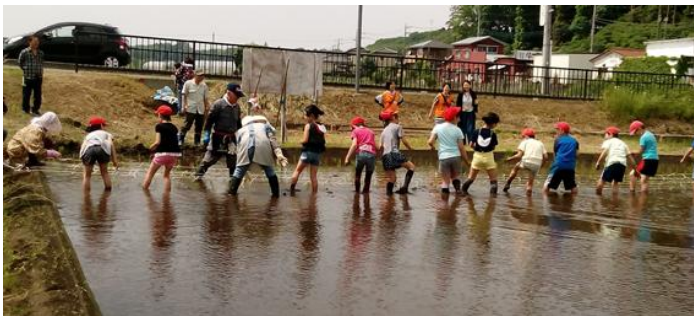
さあ準備は良いかい

今年も昨年同様、4年生を対象に田植えから餅つきまでの体験授業を行います。5月17日には田植えを実施しました。（詳細はホームページをご覧ください）