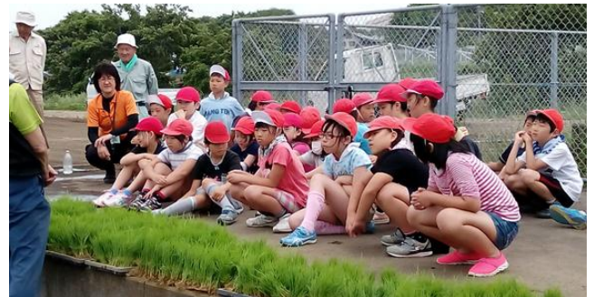
説明を神妙に聞いています