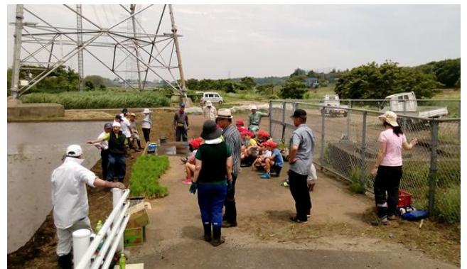
サポーターの皆さん