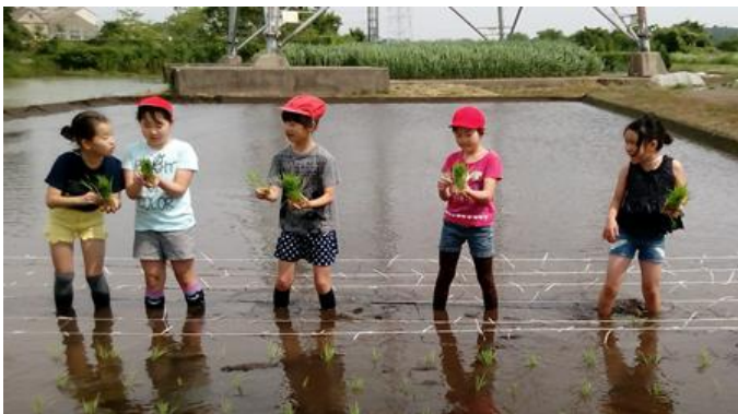
何本ずつ植えるんだっけ