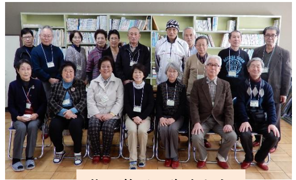
昔の遊びの先生たち

2月20日、岡田小地区社協の有志が、1年生を対象とした昔の遊び授業で、けん玉・コマ・カルタ取り・あやとり・お手玉・竹とんぼを18人の「昔の遊びの名人」という呼称で子どもたちに教えました。