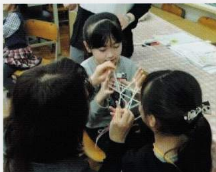
岡田小1年生・「昔の遊び」であやとり