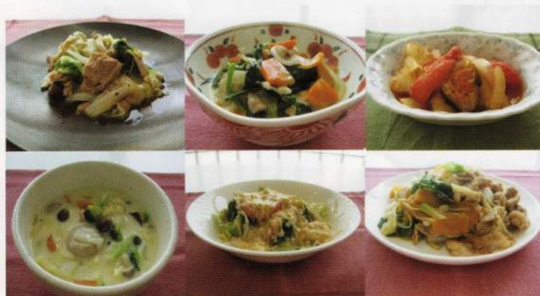
選ばれた6つの試食用レシピ

今、朝食を食べない、野菜を食べないことが問題になっています。「食育」では、「朝食に野菜を食べよう」をテーマに、6種類の朝のおかず(写真をご覧ください)を提案し、試食してもらいます。