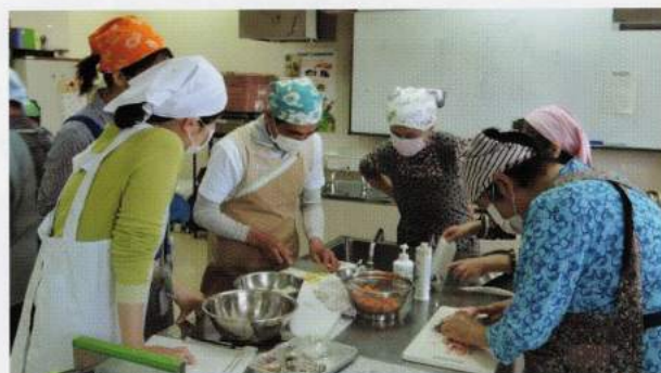
保健センターでのレシピ試作風景

校区の住民が岡田小学校に集まり、健康で長生きするためには四葉のクローバーで表現している(1)運動(2)食育(3)地域のつながり(4)忘れないでね健診の4つのモットーが大切であることを皆で確認し、地域ぐるみで健康長寿を目指すためのイベントで、現在、その準備を進めています。