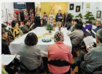
下根ヶ丘行政区・ピエンナーレ展