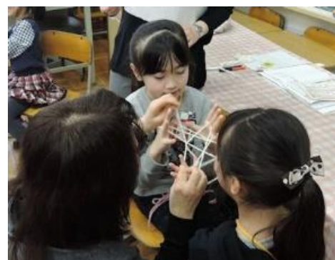
岡田小1年生・「昔の遊び」であやとり

平成28年度は合唱祭、昔の遊びについて継続実施するとともに、中学生の地域行事への協力、学校行事へのすまいるサポーターの協力など、学校との協力関係をさらに進めていく。