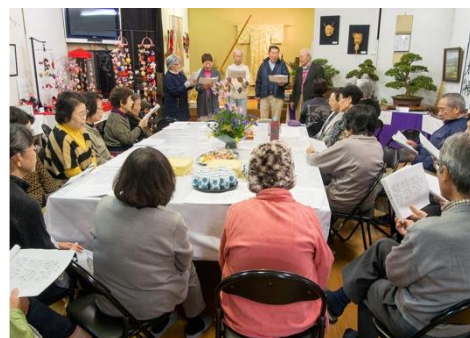
下根ヶ丘行政区・ビエンナーレ展

平成28年度は新しいサロンの立ち上げやふれあいサロンの交流を進め、地域におけるたまり場活動の活性化を図っていく。